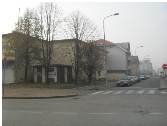
Sl. br.1 Pop Lukina ulica

Merno mesto u ul. Jovana Cvijića se nalazi u urbanom delu grada, pored saobraćajnice, udaljeno oko 500 m od centra grada. Najveće zagađenje potiče od izduvnih gasova motornih vozila i individualnih ložišta. Prikaz navedenih mernih mesta je dat na slkama br.1 i br.2